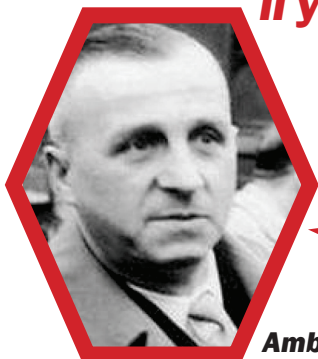
Ambroise Croizat ministre du Travail et de la Sécurité sociale entre 1945 et 1947

Si tout le monde partait à 60 ans, il y aurait des emplois pour les jeunes !